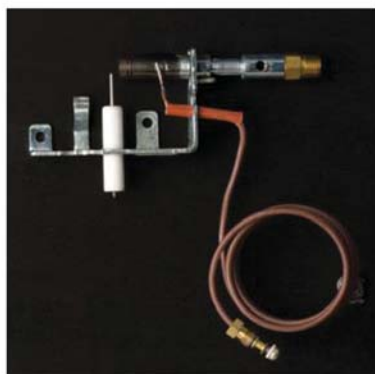
• کنترل اکسیژن (ODS)