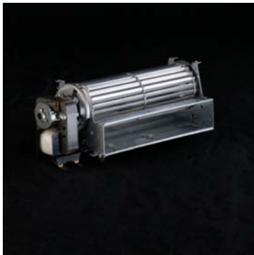
• فن بخاری