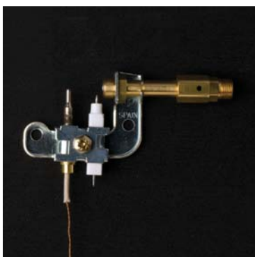
• کنترل اکسیژن (ODS)