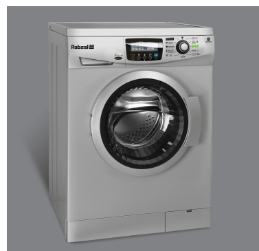
• رنگ نقره ای WRE7312-S