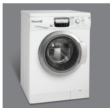
• رنگ سفید با در نقره ای WRE7312-SD