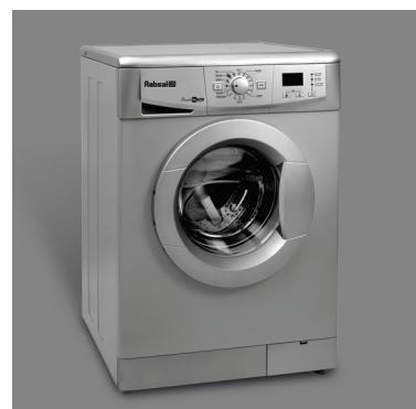
• رنگ نقره‌ای WRE5307-S