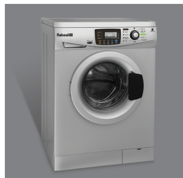
• رنگ نقره ای WRE7212-S