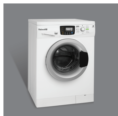
• رنگ سفید با در نقره ای WRE7212-SD